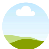
Dalila MEHALLEL - TS